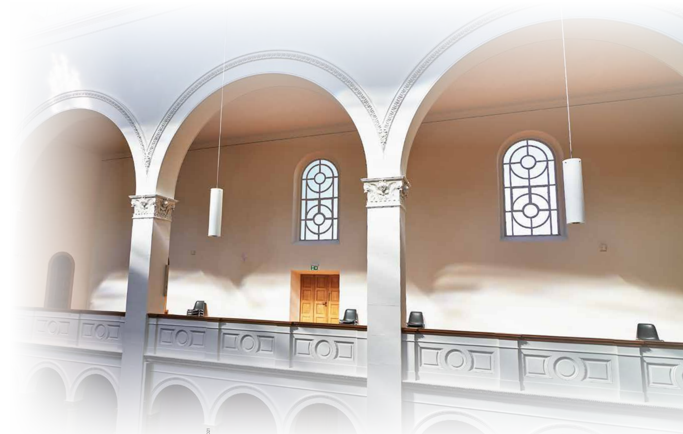
Antoniter Siedlungsgesellschaft mbH im Juni 2021

ASG Antoniter Siedlungsgesellschaft mbH im Ev. Kirchenverband Köln und Region