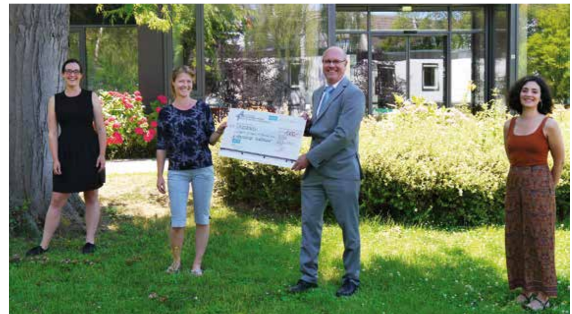
AntoniterStärktGemeindeleben – Projekt Kinderstadt Kartause

Viele unserer Kunden und Geschäftspartner sind der Anregung auch im abgelaufenen Geschäftsjahr nachgekommen und haben insgesamt 4.000 € für das Projekt „Viadukt“ gespendet, das Frauen und Männern, die in Einrichtungen der Wohnungslosenhilfe leben, wieder zu einem eigenen Zuhause verhelfen will. „Viadukt“ gibt es seit 2017. Es ist ein Kooperationsprojekt des Diakonischen Werks Köln und Region gGmbH, des Sozialdienstes Katholischer Frauen e.V. Köln und des Sozialdienstes Katholischer Männer e.V. Köln in Zusammenarbeit mit der Stadt Köln und deren Jobcenter. Seit Ende 2019 wird das Projekt im Rahmen der NRW-Landesinitiative „Endlich ein ZUHAUSE!“ gefördert.