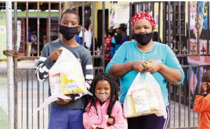
Corona-Lebensmittelhilfe in Südafrika

In den DESWOS-Projektländern in Afrika, Asien und Lateinamerika gibt es meist nur sehr schwache Gesundheitssysteme. Viele Menschen sind durch Mangelernährung und Krankheiten ohnehin geschwächt. Das Corona-Virus, das sich im vergangenen Jahr weltweit ausbreitete, traf sie ungeschützt. Menschen verloren wegen der Ausgangssperren ihre Arbeit und damit ihre Existenzgrundlage. Staatliche Unterstützungen gab es kaum. Die Armut verstärkte sich, viele Menschen hungerten. Die Projektpartner und die DESWOS stellten sich auf die veränderte Situation ein. Die Projektarbeit musste nur vorübergehend und auch nur zu Teilen in wenigen Ländern ausgesetzt werden.