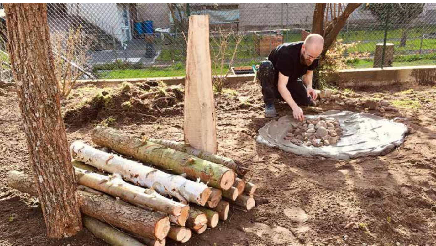
Das Garten- und Baumpflegeteam von GuR sorgt bei der ASG für ökologische und klimafreundliche Grünflächen.

Seit acht Jahren bittet die ASG ihre Geschäftspartner, von Weihnachtsgeschenken abzusehen und stattdessen einen Betrag für ein jeweils von uns benanntes soziales Projekt zu spenden.