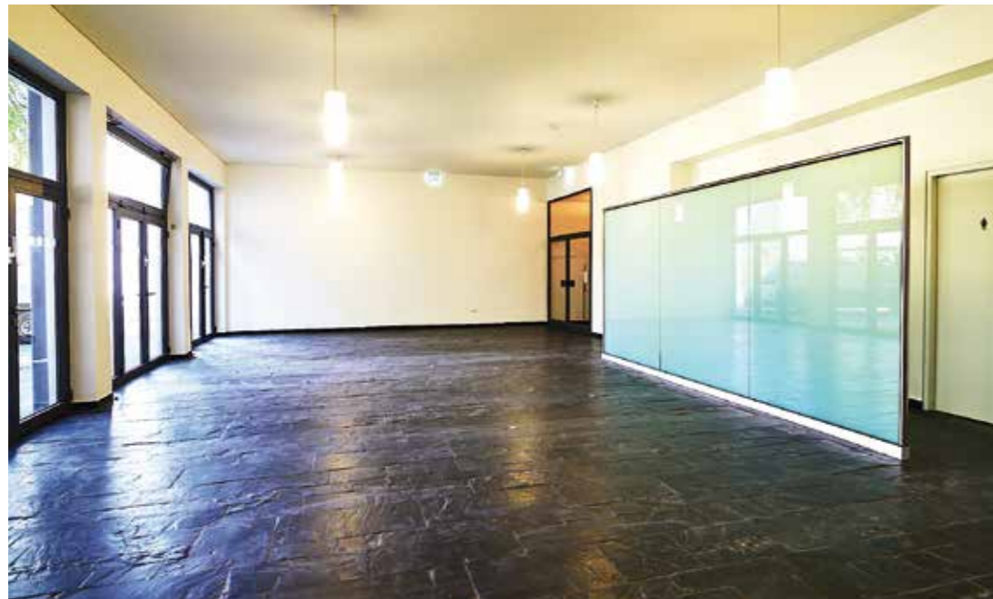
Entrée zum Garderobenhaus der Trinitatiskirche