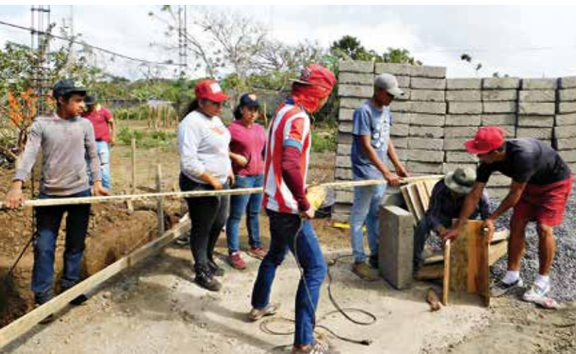
Gemeindeentwicklung Mirazul del Llano – Maurerausbildung